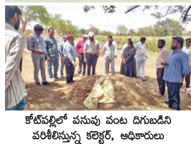
కోటపల్లిలో వసవు వంట దిగుబడిని పరిశీలిస్తున్న కలెక్టర్, అధికారులు

కీలక పుణ్య స్వాధీనం ఇబ్రహీంపట్నం మండల పరిషత్ కార్యాలయం బుధవారం విజిలెన్స్ అధికారుల రాకతో ఒక్క సారీగా కలకలం రేగింది. రాష్ట్ర విజిలెన్స్ అండ్ ఎన్ఫోర్స్ మెంట్ డి.జి. శిఖాగౌయర్ ఆదేశాల మేరకు అధికారులు తనిఖీలు నిర్వహించారు. ఉదయం కార్యాలయానికి చేరుకున్న బృందం తనిఖీలు చేపట్టింది. కంప్యూటర్ లోని డేటా, కీలక పుణ్య స్వాధీనం చేసుకున్నారు. పథకాల అమలు, నిధుల వినియోగం, కార్యాలయ సిబ్బంది హాజరు రిజిస్ట్రీకు సంబంధించిన రికార్డులను నిశితంగా పరిశీలించి వాటి జిరాఫీలను తీసుకున్నారు. బయోమెట్రిక్ యంత్రాల ద్వారా సిబ్బంది హాజరు పట్టికను విశ్లేషించారు. ఉన్నతాధికారులు అందుబాటులో లేకపోవడంతో కింది స్థాయి సిబ్బందిని అధికారులు వివేచించారు. మధ్యాహ్నం అధికారులు కార్యాలయానికి వెళ్తున్న సమయంలో పాటు పంచాయితీ కార్యదర్శులను కార్యాలయానికి పిలిపించి ఎంపీలు, తదతర రికార్డులను పరిశీలించారు. తనిఖీలు పూర్తి అయిన తర్వాత మీడియాకు పూర్తి వవరాలు వెల్లడిస్తామని తెలిపిన విజిలెన్స్, ఎన్ఫోర్స్ మెంట్ అధికారులు వివరాలు వెల్లడించకుండానే వెనుదిరిగారు. ఈ దాడులతో పక్కనే ఉన్న ఇతర ప్రభుత్వ కార్యాలయాల్లోనూ వణుకు మొదలైంది.