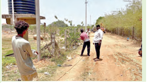
సోలిపూర్లో విద్యుత్ తీరలను సరి చేస్తున్న విద్యుత్ సిబ్బంది