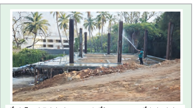
మేడ్చల్ పెద్ద చెరువు కట్టపై ర్యాంపు వేసి.. నిర్మాణాలు చేస్తున్న ద్వుత్వ