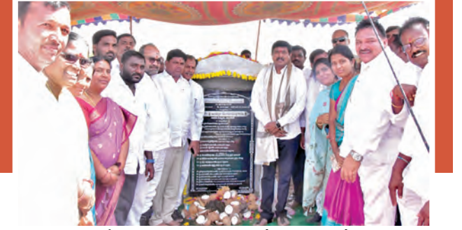
రోడ్డు పనులకు శంకుస్థాపన చేస్తున్న ఎమ్మెల్యే

మా దృష్టికి వచ్చింది, చర్యలు తీసుకుంటాం: తహశీల్దార్ పెద్ద చెరువు పరిధిలో బఫర్ జోన్, ఎఫ్ డిఎల్ ఉల్లంఘనలపై వస్తున్న ఆరోపణలు మా దృష్టికి వచ్చాయి. చెరువు వద్ద జరుగుతున్న నిర్మాణాలపై పూర్తి స్థాయి నివేదిక ఇవ్వాలని నిబంధించి రెవెన్యూ, ఇరిగేషన్, మున్సిపల్ శాఖ అధికారులను ఆదేశించాం. బఫర్ జోన్లో నిర్మాణాలు, చెరువు కట్టకు అనుకుని ర్యాంపులు ఏర్పాటు చేయడం వంటి విషయాలపై నిజానిజాలు సమగ్రంగా పరిశీలించి, నిబంధనలు ఉల్లంఘించిన చర్యలు తీసుకుంటాం.