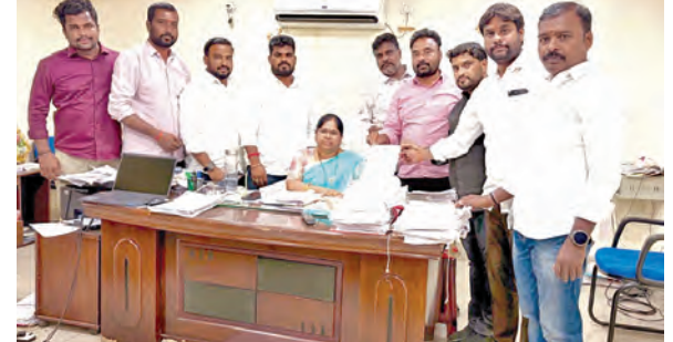
ఆర్డీకు వివరించడం అందజేస్తున్న నేతలు