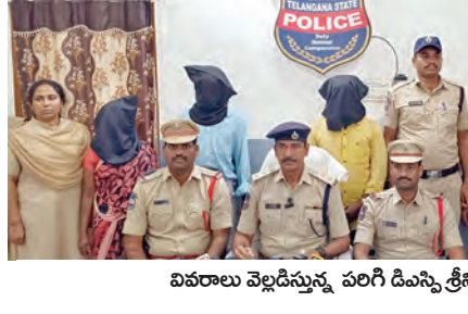
వధరాలు వెళ్లడమైన పరిగి దీనిని తీరించిన