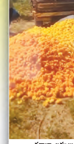
రవాణా ఖర్చులు కూడా భారవేసినంతో వెలిబిడల్లో రహదారిపై పూలు పారబోస్తున్న రైతు

పక్కతి ఒడిలో విరబూసి, శుభకార్యాలకు కళకు తెచ్చే బంతి, చామంతి పూలు నేడు రైతుల కళ్లలో కన్నీరు తెప్పిస్తున్నాయి. పండించిన పంటకు సరైన ధర అందకపోవడంతో రైతుల కళ్లు బూడిదలో పోసిన పన్నీరుగా మారుతోంది. పూల తోటలు వర్షశోభితంగా కనిపిస్తున్నా వాటి వెనుక ఉన్న రైతుల జీవితాలు మాత్రం చీకటిమయమవుతున్నాయి. ప్రస్తుతం ఫరూఖ్ నగర్ మండలం వెల్ జిల్లాలో పరిస్థితి హృదయవిధారకంగా మారింది.