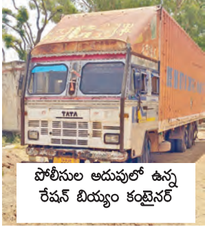
పోలీసుల ఆదుపులో ఉన్న రేషన్ బియ్యం కంట్రెనర్

యాలా, ఏప్రిల్ 8, ప్రభాతవార్త : ప్రభుత్వం పేదలకు ఉచితంగా అందజేస్తున్న రేషన్ బియ్యం పక్కదారి పట్టింది. భారీ ఎత్తున భక్తి మార్కెట్ కు తరలిపోతున్న బుధవారం షాద్ నగర్ నుంచి జహీరాబాద్ కు అక్రమంగా తరలిస్తున్న సుమారు 190 క్వింటాళ్ల రేషన్ బియ్యాన్ని స్వాధీనం చేసుకున్నారు. ర్యాలుల ఎన్ఎస్ విలెట్ రెడ్డి తెలిపిన వివరాల ప్రకారం, కోడంగల్ తాండూరు ప్రధాన రహదారిపై ఉన్న గౌతమి స్కూల్ సమీపంలో యాలా, టాస్కో ఫోర్స్ పోలీసులు బియ్యం క్రగా వాహన తనిఖీలు చేపట్టారు. ఈ తనిఖీలో టాటా కంట్రెనర్ వాహనం అనుమానాస్పదంగా కనిపించడంతో తనిఖీ చేశారు.