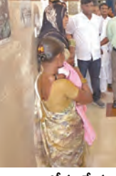
ఆరోగ్య సేవల తీరుపై మహిళా రోగులతో మాట్లాడుతున్న అదనపు కలెక్టర్