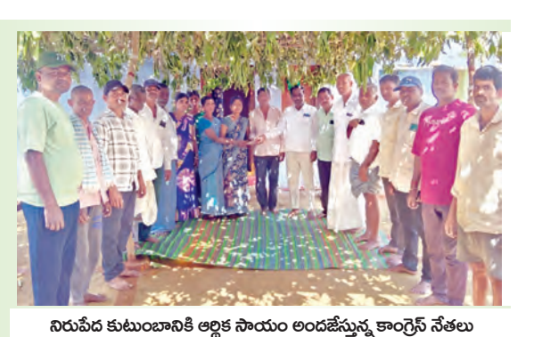
నిరుపేద కుటుంబానికి ఆర్థిక సాయం అందజేస్తున్న కాంగ్రెస్ నేతలు